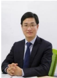
吴 健教授，博士生导师